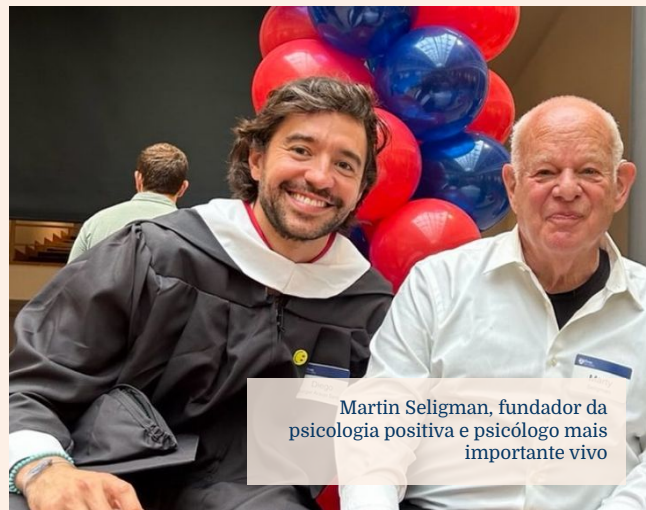
Martin Seligman, fundador da psicologia positiva e psicólogo mais importante vivo

50% mais lucratividade 57% mais valor de mercado 30% mais produtividade 25% menos turnover 11% menos absenteísmo